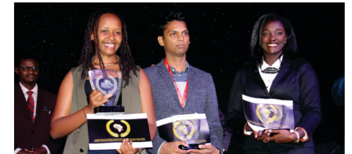
Creative Lab Winner et finalistes